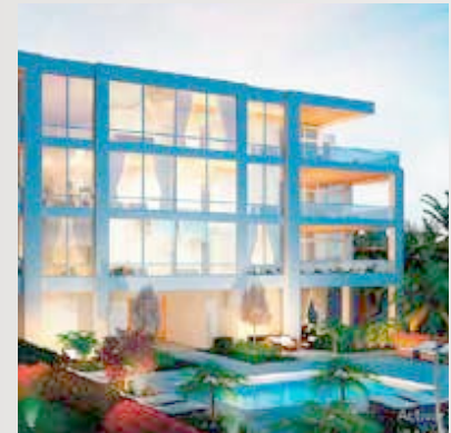
FLORIDA USA Edificio Sarasota