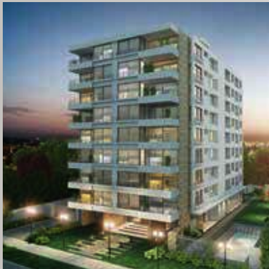
PROVIDENCIA Edificio Silvana Plaza