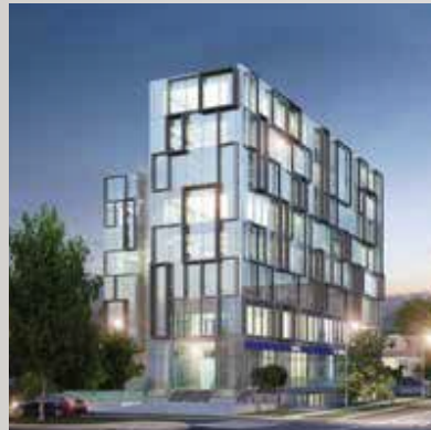
VITACURA Edificio Plaza Costanera